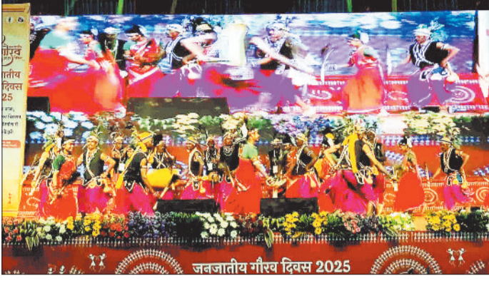
सांस्कृतिक कार्यक्रमों की प्रस्तुति देते कलाकार।