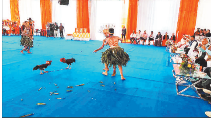
मुर्गा लड़ाई का प्रदर्शन करते बच्चे।