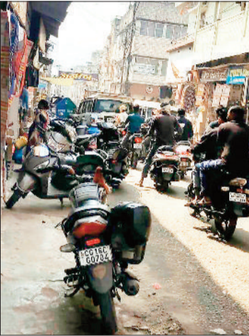
ऐसे लगता है शहर में जाम।