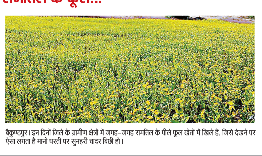
बैकुण्ठपुर। इन दिनों जिले के ग्रामीण क्षेत्रों में जगह-जगह रामतिल के पीले फूल खेतों में खिले हैं, जिसे देखने पर ऐसा लगता है मानों धरती पर सुनहरी चादर बिछी हो।